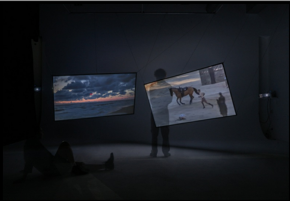
We Are Not So Far Away, It's Just Water