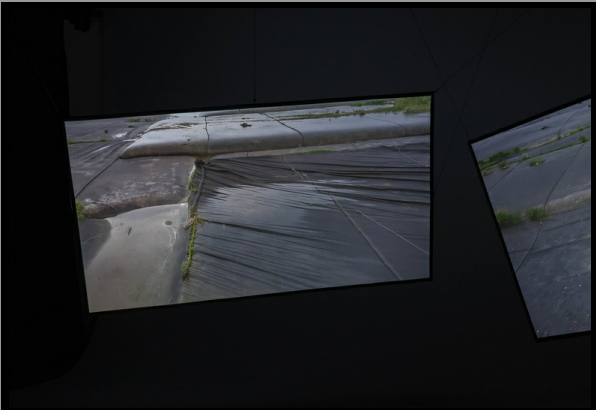
We Are Not So Far Away, It's Just Water