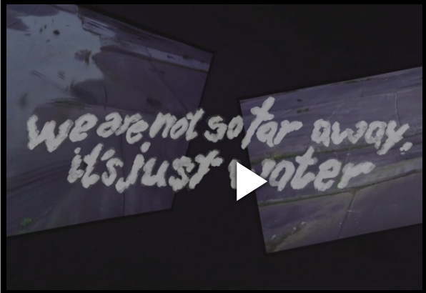
Trailer sur Vimeo