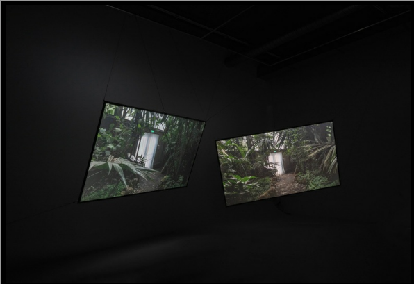
We Are Not So Far Away, It's Just Water