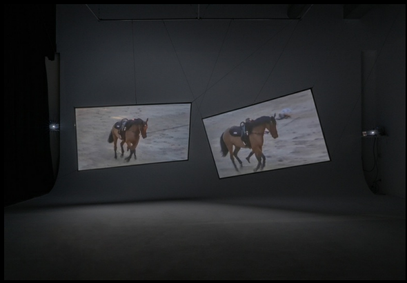
We Are Not So Far Away, It's Just Water